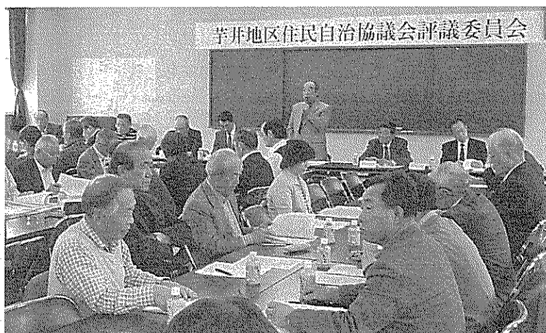
<評議委員会の模様>

会議では、「会則・規則・組織の改正」「平成23年度の事業報告及び決算」「平成24年度の事業計画及び予算」等について協議が行われ、それぞれの案件が可決承認されました。